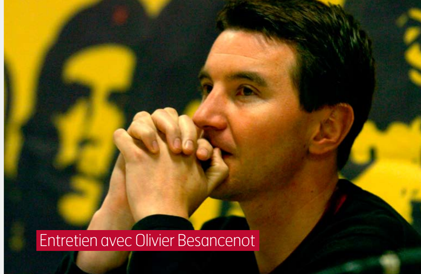
Entretien avec Olivier Besancenot

Durant la guerre froide, deux modèles de société se sont opposés. Il y avait le modèle capitaliste à l'Ouest, le modèle bureaucratique dans les pays de l'Est. Dans les deux cas, une minorité d'individus décidait pour la majorité, d'un côté les riches, de l'autre les apparatchiks. La troisième voie, celle qui n'a jamais été tentée, serait un modèle où la majorité déciderait pour elle-même. Il lui reviendrait de contrôler, posséder, répartir la totalité des richesses. Cela implique une organisation du pouvoir décentralisée, où tout ce qui peut être décidé localement l'est – dans les quartiers ou les entreprises. Il faudrait aussi faire en sorte que l'action des pouvoirs publics et des politiques se fasse toujours sous contrôle de la base. À cette fin, la révocabilité des élus est nécessaire (si un élu remplit mal son mandat, il peut être révoqué à l'issue de nouvelles élections convoquées suite à une pétition par exemple), ainsi que le suffrage universel et la démocratie directe, qui s'exprimerait à travers des assemblées de conseils. Il faut aussi être attentif à la rémunération des élus, qui ne doit pas excéder le salaire moyen de la population... Le but est d'éviter la tentation aristocratique ou totalitaire. Aujourd'hui, la machine étatique est du côté des riches, comme on le voit lorsqu'elle