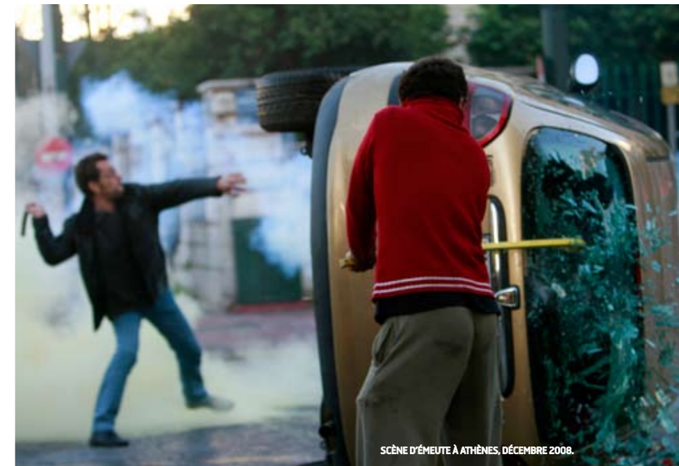
SCÈNE D'ÉMEUTE À ATHÈNES, DÉCEMBRE 2008.

Il semblerait que nous soyons désormais entrés dans cette phase historique où le capitalisme, tout à fait refermé sur lui-même, est sur le point de s'autodétruire. C'est une période inédite, de risque maximal, qui a été très bien diagnostiquée par le philosophe italien Toni Negri. Plutôt que de parler de capitalisme, ce dernier préfère employer le concept d'« empire » pour nommer cette nouvelle réalité du pouvoir planétaire. Pour lui, si « le pouvoir peut toujours être cassé quelque part », « désormais, il est clair que la cassure ne viendra pas du dehors. Elle doit se faire de l'intérieur ». (1) Jean Baudrillard faisait en 2002 un constat convergent, mais nettement plus noir, dans un article intitulé « La violence de la mondialisation » : « L'humain règne seul désormais, mais il n'a plus de raison finale. N'ayant plus d'ennemi, il le génère de l'intérieur, et sécrète toutes sortes de métastases inhumaines. De là cette violence du mondial – violence qui traque toute forme de négativité, de singularité, y compris cette forme ultime de singularité qu'est la mort elle-même. » (2) Résumons : si, après 1989, il apparaît illusoire et inconséquent de se dire « anticapitaliste », puisqu'il