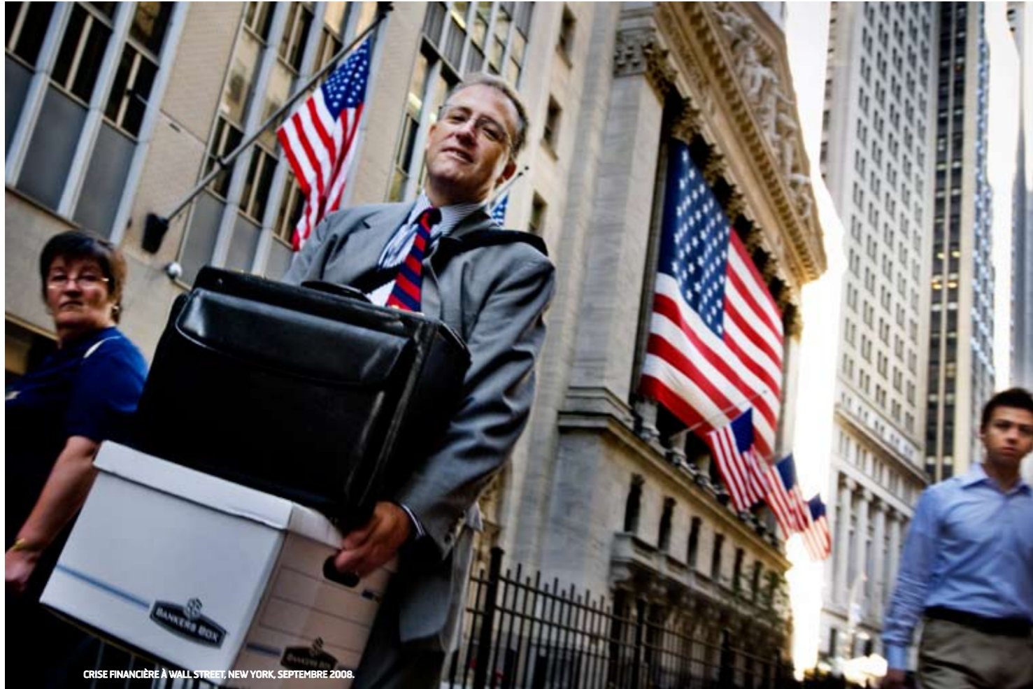
CRISE FINANCIÈRE À WALL STREET, NEW YORK, SEPTEMBRE 2008.

“ IL EST CLAIR QUE LA CASSURE NE VIENDRA PAS DU DEHORS. ELLE DOIT SE FAIRE DE L'INTÉRIEUR. ” TONI NEGRI